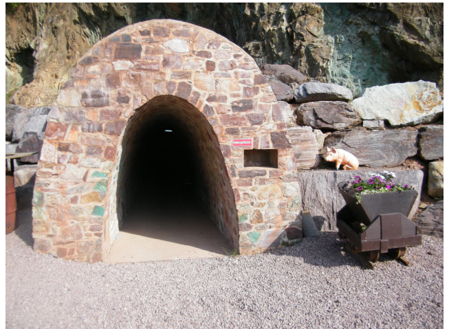
Bilder von der Lehrfahrt 2011: Rundgang in der Fischzucht und der Eingang zum Kupferbergwerk

Da durch die Gruppenführung nicht alle Teilnehmer gleichzeitig beschäftigt sind, werden andere Gruppen parallel durch das nahe Kupferbergwerk „Wilhelmine“ geführt. Die Innentemperatur beträgt nur ca. 10°C: Warm anziehen! Weitere Infos hierzu unter www.bergwerk-im-spessart.de . Den Abschluss bildet der Besuch des Kletterwaldes in Heigenbrücken . Auf mehreren Parcours mit verschiedenen Schwierigkeitsgraden können die Teilnehmer ihren Mut und ihre Geschicklichkeit auf die Probe stellen. Für dieses als pädagogisch sehr wertvoll bezeichnete Abenteuer müssen allerdings Teilnehmer unter 18 Jahren die unterzeichnete Einverständniserklärung ihrer Eltern (im Anhang) vorlegen. Die Klettergebühr ist in der Anmeldegebühr enthalten. Es werden Garten- oder Arbeitshandschuhe benötigt, die allerdings auch für 2,50 € vor Ort erstanden werden können. Wichtig: Sicherheit steht an 1. Stelle! Mehr Infos unter www.kletterwald-spessart.de